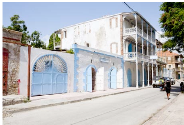
Hôtel Florita, façade

Le patrimoine de la ville de Jacmel est surtout connu à l'étranger pour ses paysages et l'architecture de son centre historique. Chef-lieu du département du Sud-Est, cette ville d'environ 40 000 habitants offre des vues saisissantes tant sur la baie qui porte son nom que sur les vallées verdoyantes et les pics de l'arrière-pays. Les sols fertiles des plaines et des plateaux soutiennent de petites cultures diversifiées créant un paysage rural riche et varié qui retient le regard. À l'Est, se trouvent plusieurs petites criques avec leurs plages de sable fin et des hôtels modernes servant des plats typiquement haïtiens qui font de Jacmel une station balnéaire et touristique de choix. Le centre historique était composé de belles maisons de particuliers et de commerce avec balcons en dentelles et arcades en fonte et en fer, construites pour la plupart à la fin du 19 e siècle à la suite d'un incendie qui a ravagé la ville. À ce noyau, vient s'ajouter le marché, appelé Marché en fer en raison de sa structure en fer moulé, la majestueuse cathédrale néo-baroque et son cimetière, la maison de la douane avec son imposante et très originale halle métallique et la Place d'Armes qui conserve la mémoire de plusieurs éléments marquants du paysage historique d'Haïti. L'ensemble est d'une rare harmonie architecturale. D'ailleurs, le centre historique de Jacmel a été inscrit en 2004 par Haïti sur sa liste indicative en vue d'une inscription sur la Liste du patrimoine mondial de l'UNESCO.